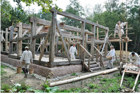
Mittelalterliche Baustelle in der Freilichtanlage Campus-Galli